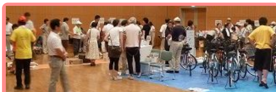
自転車、扇風機、洗濯機は抽選。 当たった人には拍手が送られました。

4月から月に3回「訪問ボランティア」を実施している太田市社会貢献活動連絡協議会は、不足している夏物衣類や自転車などの提供を尾島・世良田地区などに呼びかけました。集められた大量の生活物資は、市内に避難されている方々に無償で提供されました。