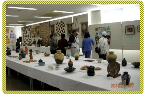
写真は昨年の様子です