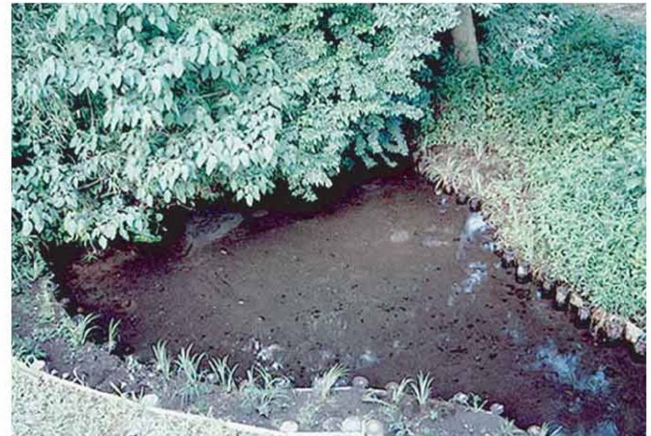
写真：矢太神沼の湧水点 ホテルの里公園の北端にある矢太神沼は、かつての面影を残す湧水地で自噴現象も見られます。「新田荘遺跡・矢太神水源」として国指定史跡になっています。