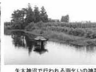
矢太神沼で行われる雨乞いの神事

新田地域には「井」の付く地名が多いことでもわかるように、古来、多くの湧水地があり生活用水や農業用水として利用されてきました。こうした湧水は地域の人々によって大切に守られてきましたが、近年では湧水地をとりまく環境は悪化してきています。