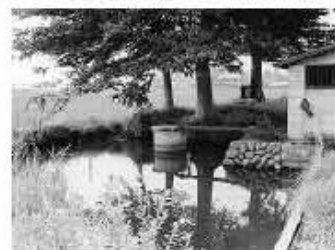
かつては豊富に湧いていた井天湧水

湧水地の保全は地域のみでの努力では限界があることがわかり、地域でも保全活動を積極的に進めている美濃谷戸湧水地について、地域の意見を聞きながら保全計画として取りまとめ、平成16年10月25日に「新田環境みらいの会」として町長（当時）に保全の要望書を提出しました。その結果、一部、護岸や園路の整備が行われました。