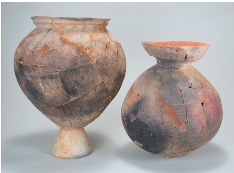
なかみぞ ふかまち いせき 中溝・深町遺跡第32号住居跡出土遺物（台付甕・壺） 〔平成6～8年度新田東部工業団地造成に伴う発掘調査〕