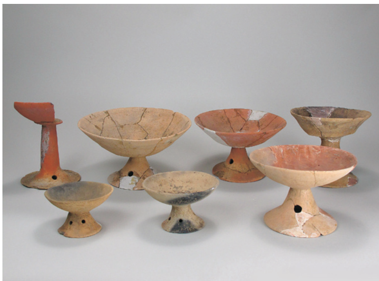
石田川遺跡出土土器（高坏） 〔昭和27年堤防構築工事に伴う発掘調査〕