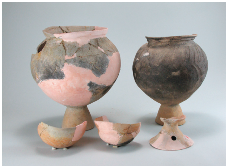
歌舞妓遺跡第162号住居跡出土土器 （台付甕・鉢形土器・器台） 〔昭和58～60年度尾島工業団地造成に伴う発掘調査〕