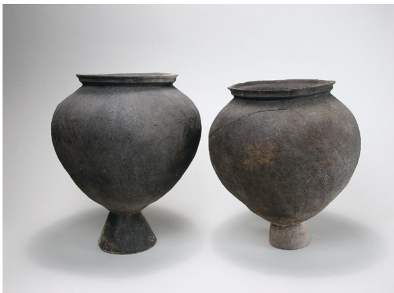
むらたほんごう いせき なかみぞ いせき 村田本郷遺跡・中溝遺跡出土土器（台付甕） 〔昭和61・62年度新田東部地区ほ場整備事業に伴う発掘調査〕