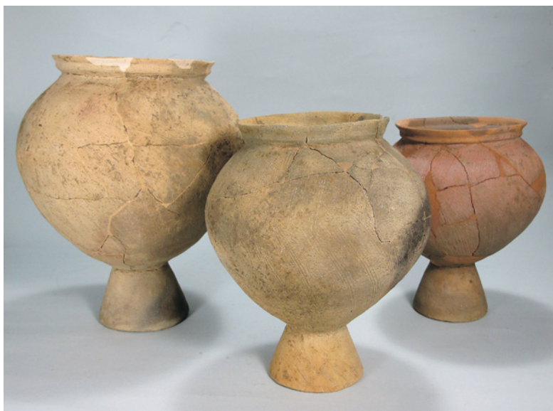
石田川遺跡出土土器（台付甕） 〔平成8年度河川改修工事に伴う発掘調査〕

外観はS字状に屈曲した口縁部、大きくはらんだ胴部が特徴。薄く仕上げられた器壁、外側は櫛状の工具によって装飾されている。下部には炉の中で自立するように台が付いている。