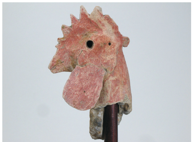
石田川遺跡出土の鶏形埴輪の頭部。彩色されている。