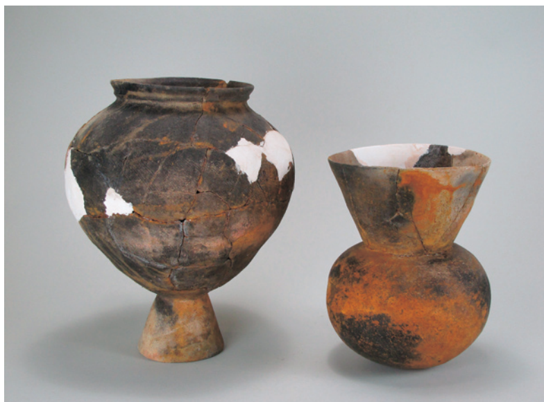
いっぼんすぎ いせき 一本杉Ⅱ遺跡第3号住居跡出土土器（台付甕・埴） 〔平成6～8年度新田東部工業団地造成に伴う発掘調査〕