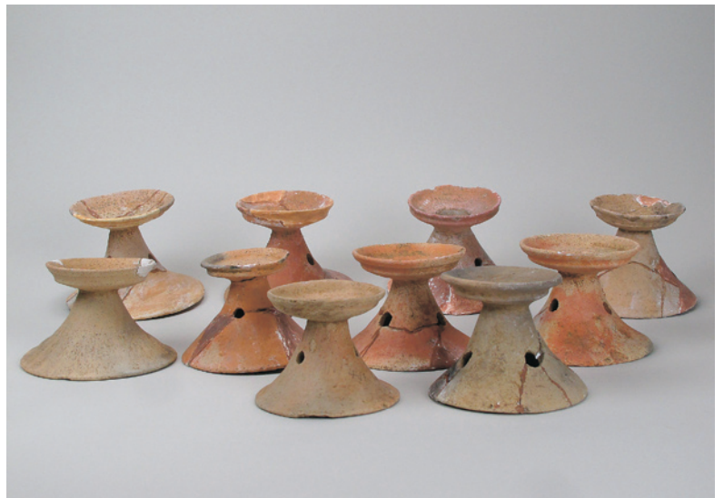
石田川遺跡出土土器（器台） 〔昭和27年堤防構築工事に伴う発掘調査〕