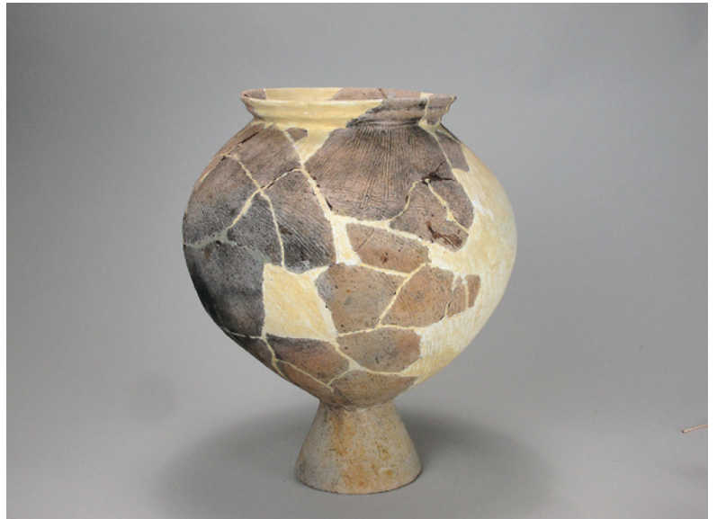
こたんだい いせき 五反田遺跡出土土器（台付甕） 〔昭和47年度宝泉住宅団地造成事業に伴う発掘調査〕