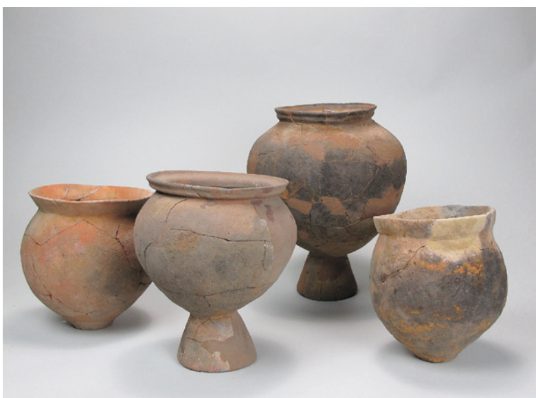
中道遺跡出土土器（甕・台付甕） 〔昭和50・51年度送電線建設に伴う発掘調査〕