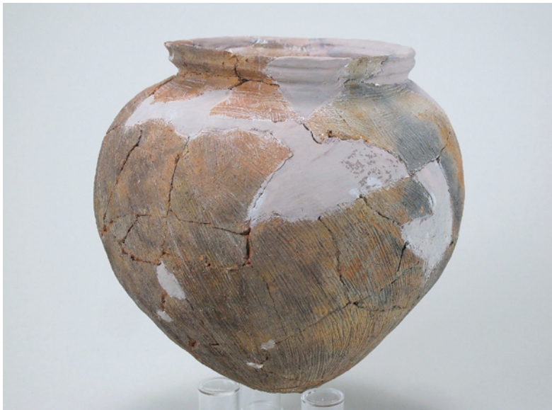
花園遺跡A区第7号住居跡出土土器（台付甕） 〔平成元年度国道354号道路改良に伴う発掘調査〕