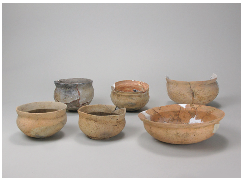
石田川遺跡出土土器（鉢形土器） 〔昭和27年堤防構築工事に伴う発掘調査〕