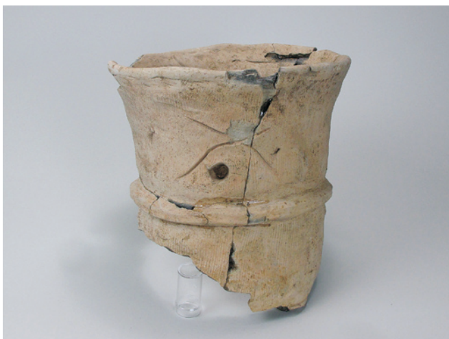
石田川遺跡出土の円筒埴輪

昭和27年堤防構築工事に伴う発掘調査出土。消失してしまった古墳の埴輪であると推測される。 5世紀後半代のものであると思われる。