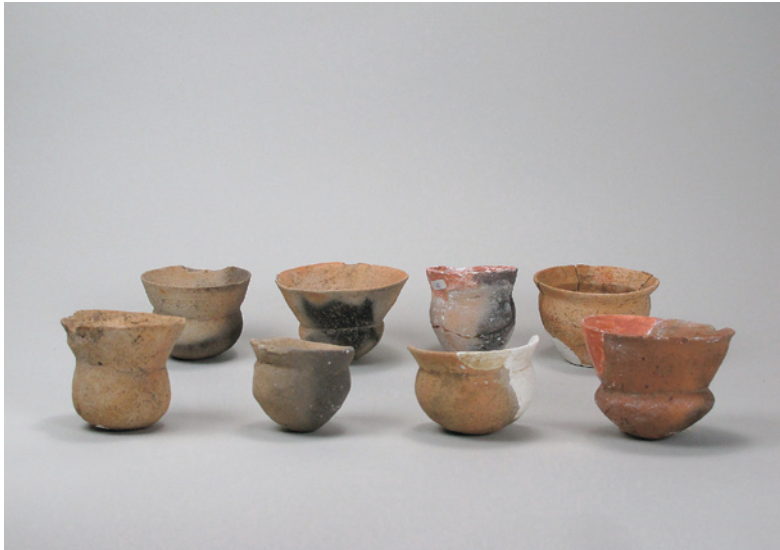
石田川遺跡出土土器（小形丸底埴） 〔昭和27年堤防構築工事に伴う発掘調査〕