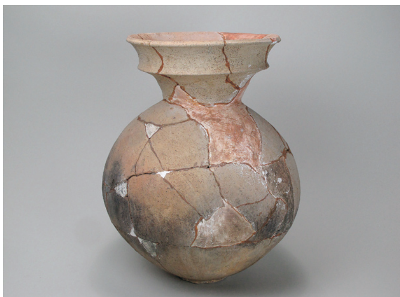
石田川遺跡出土土器（壺） 〔昭和27年堤防構築工事に伴う発掘調査〕