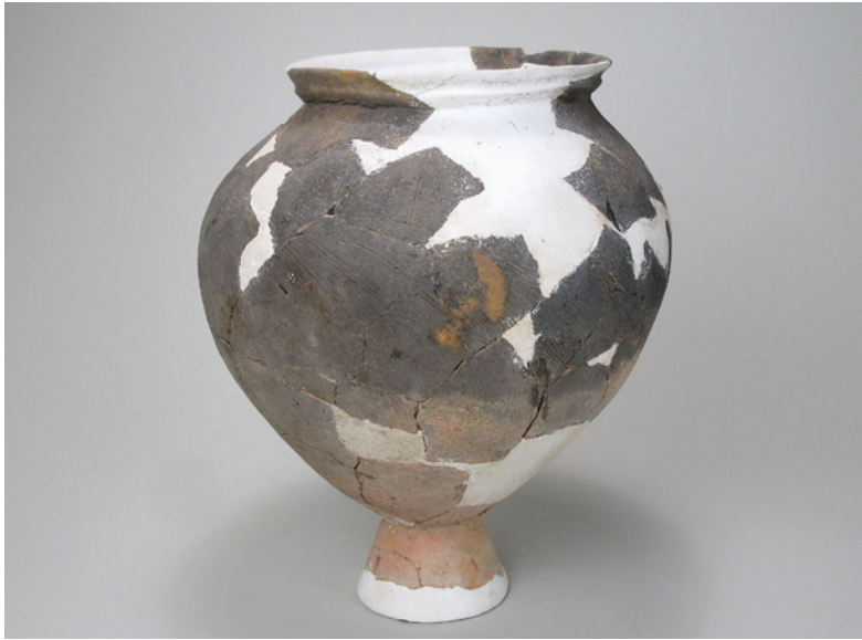
いしいまい いせき 西今井遺跡出土土器（台付甕） 〔平成元年度新田西部第2工業団地造成に伴う発掘調査〕