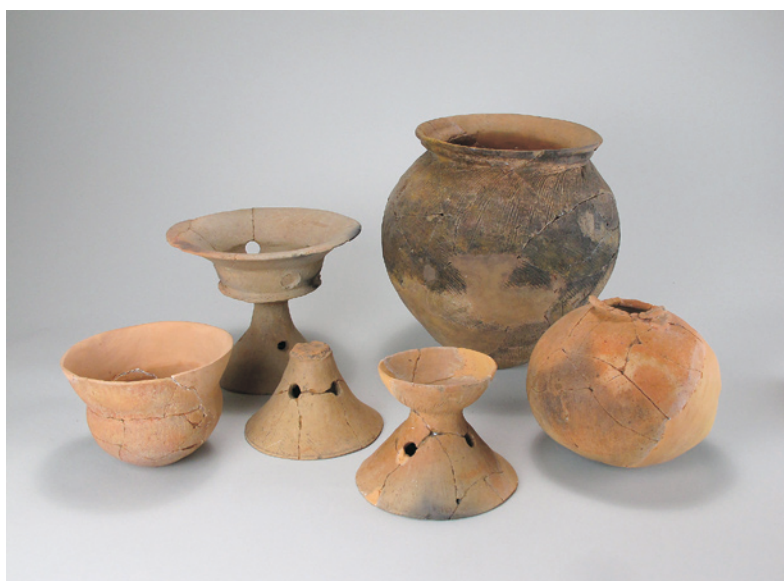
じゅうどの いせき 重殿遺跡2次調査第12号住居跡出土遺物 （台付甕・壺・器台・埴） 〔昭和58年度市前ほ場整備事業にともなう発掘調査〕