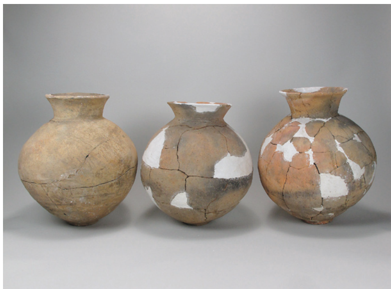
石田川遺跡出土土器（壺） 〔昭和27年堤防構築工事に伴う発掘調査〕