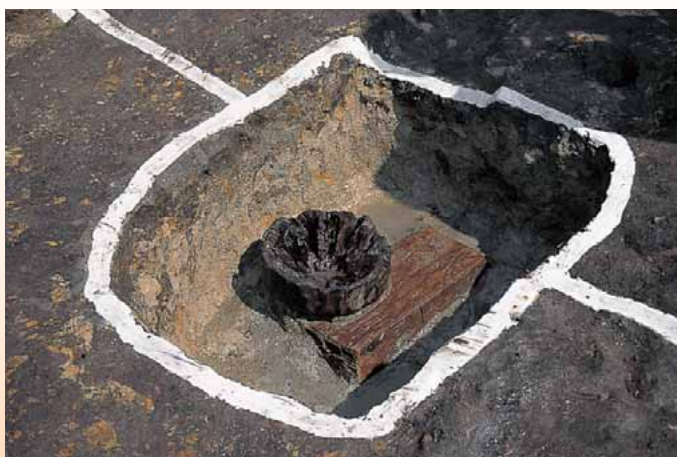
柱と礎板の出土状況