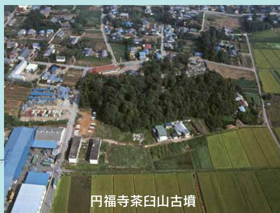
円福寺茶臼山古墳