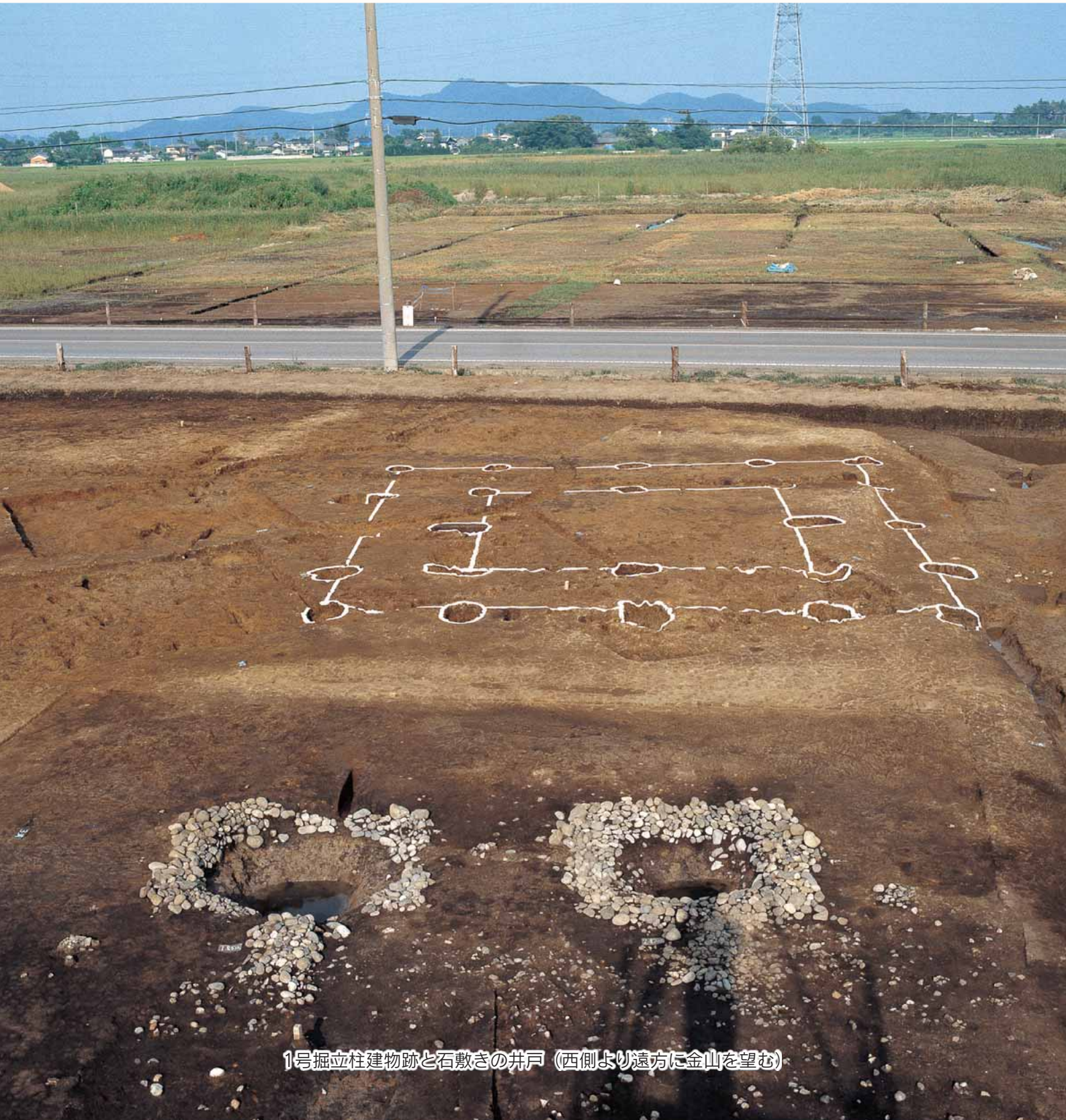
1号掘立柱建物跡と石敷きの井戸（西側より遠方に金山を望む）