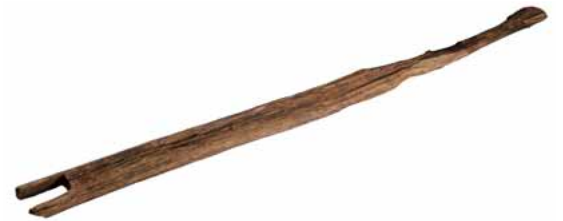
ほぞ穴のあいた柱材