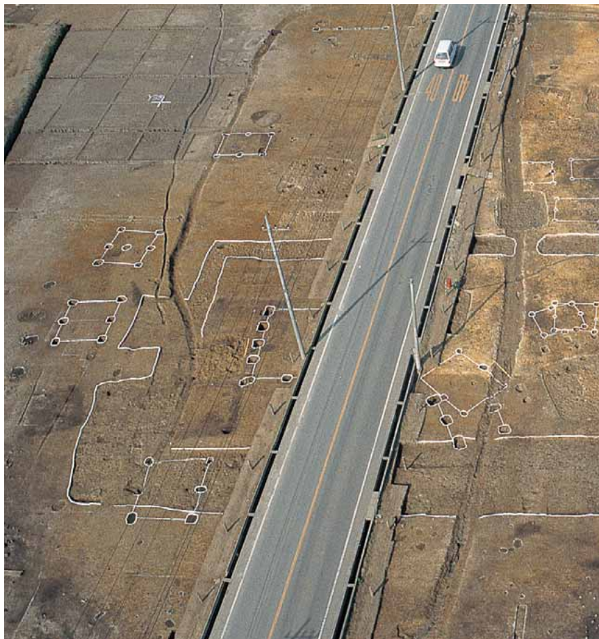
上空南側から撮影した方形区画（17号溝、2号・3号掘立柱建物跡）

区画内には住居跡も数軒確認されていますが、17号溝、2号・3号掘立柱建物跡と同時期に存在したものは確認されませんでした。豪族の住んだ場所、倉庫、まつりを執り行なった場所などいろいろと考えられていますが、はっきりとしたことはわかっていません。