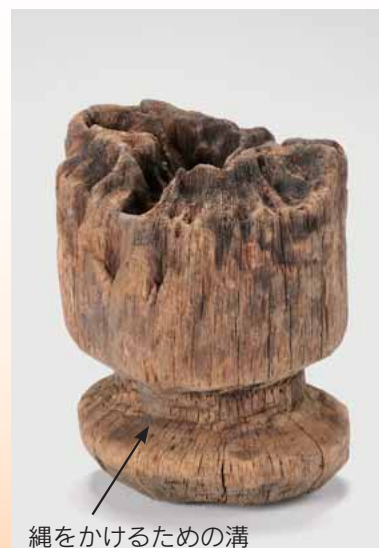
縄をかけるための溝

2号掘立柱建物跡の柱穴から出土した柱には、柱の運搬時に縄をかけるための溝が彫られています。また、柱の底部には工具による加工の跡もみられます。