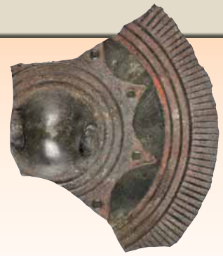
銅鏡（22号住居跡出土）

22号住居跡からは小型の銅鏡 ないこうかもんきょう （内行花文鏡）の破片が出土し、32号住居跡からはガラス玉が出土するなど古墳の副葬品（ふくそうひん）に使われるような遺物が出土しています。また、32号住居跡からはそのほかにも胴部下側にわざと穴をあけられた壺が出土し、住居の床下には小型の土器が埋納されていました。これらの特殊な土器はまつりに使われていたものと考えられ、何代にもわたりこの地を収めた豪族がこの場所でまつりを執り行っていたことがうかがえます。