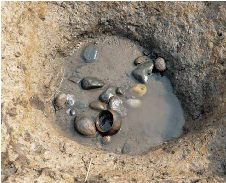
祭祀に使われた土器の出土状況