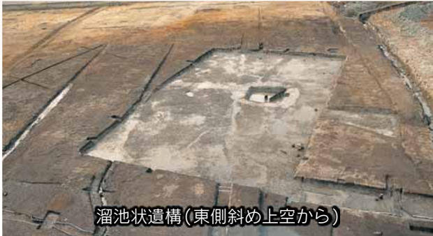
溜池状遺構(東側斜め上空から)