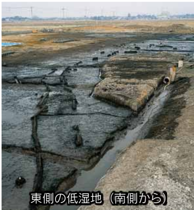
東側の低湿地(南側から)