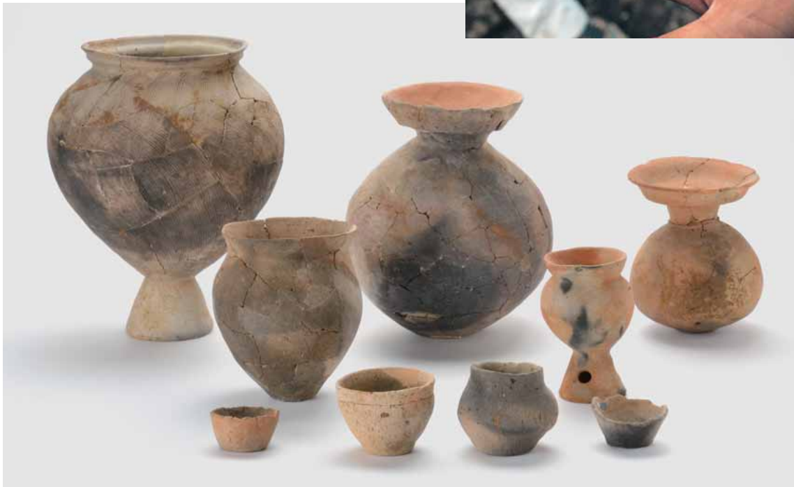
32号住居跡出土の土器