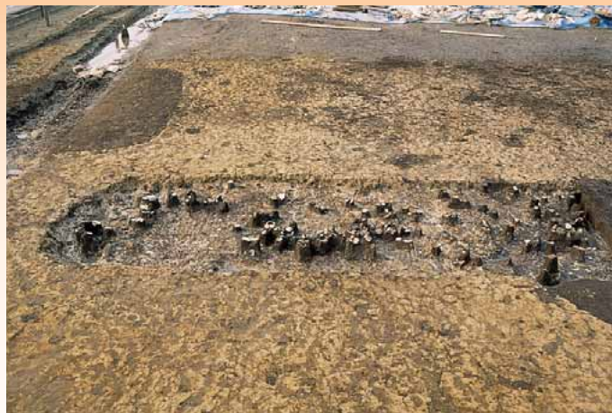
17号溝遺物出土状況

東西47m×南北20mの長方形の範囲を区画する溝で、幅は南側の広いところで約6m、北側の狭いところで約3mとなっています。溝の北辺中央部では溝が途切れていて、出入り口であったと思われます。また、溝の西辺及び南辺の一部に外から張出しを持つ部分があり、ここには溝を渡るための橋が架かっていた可能性があります。溝の中からは古墳時代前期の土器が大量に出土しました。