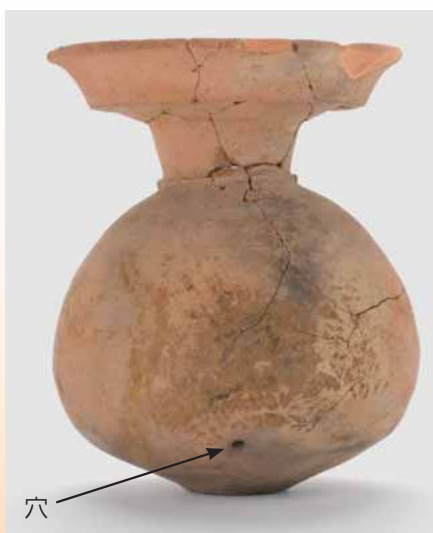
胴部に穴のあけられた壺