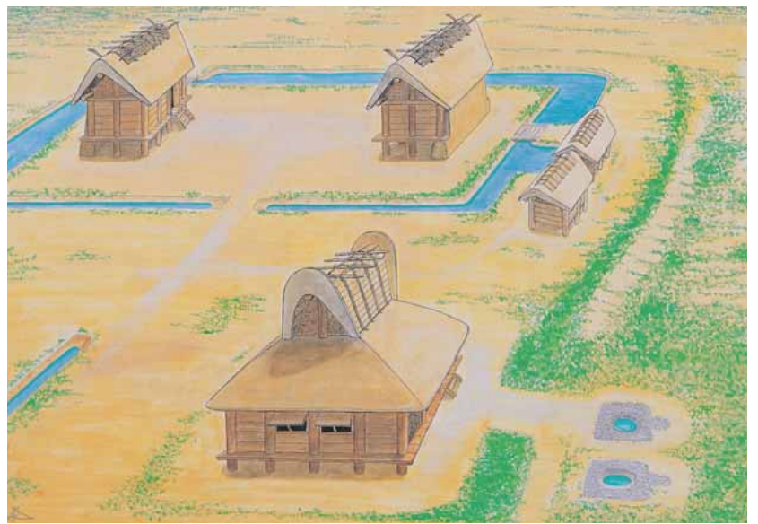
方形区画周辺の復元予想図(北から)