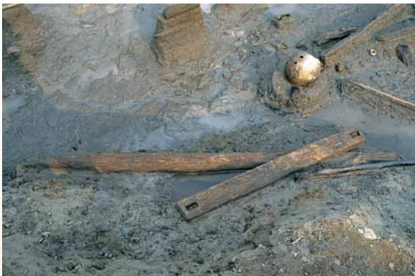
一本杉II遺跡30号溝木製品出土状況