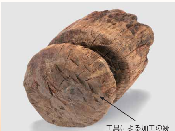
工具による加工の跡