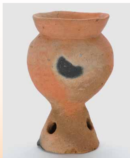
床下に埋められていた土器