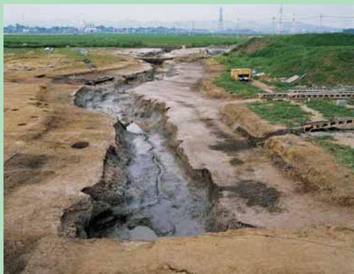
一本杉II遺跡30号溝(南から)