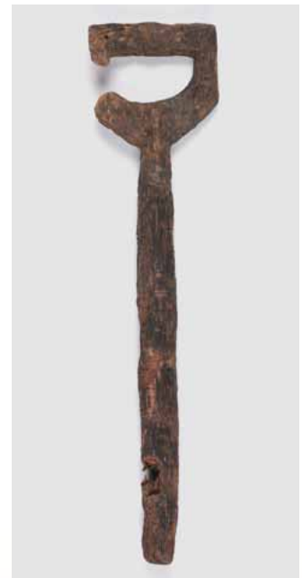
石敷き井戸から出土の鋤の柄