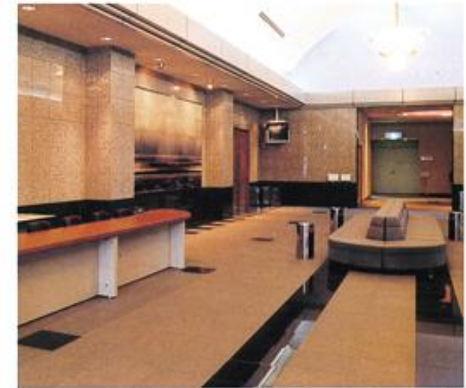
▲ ホール I