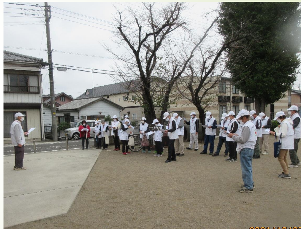
新型コロナ対策のため外で！