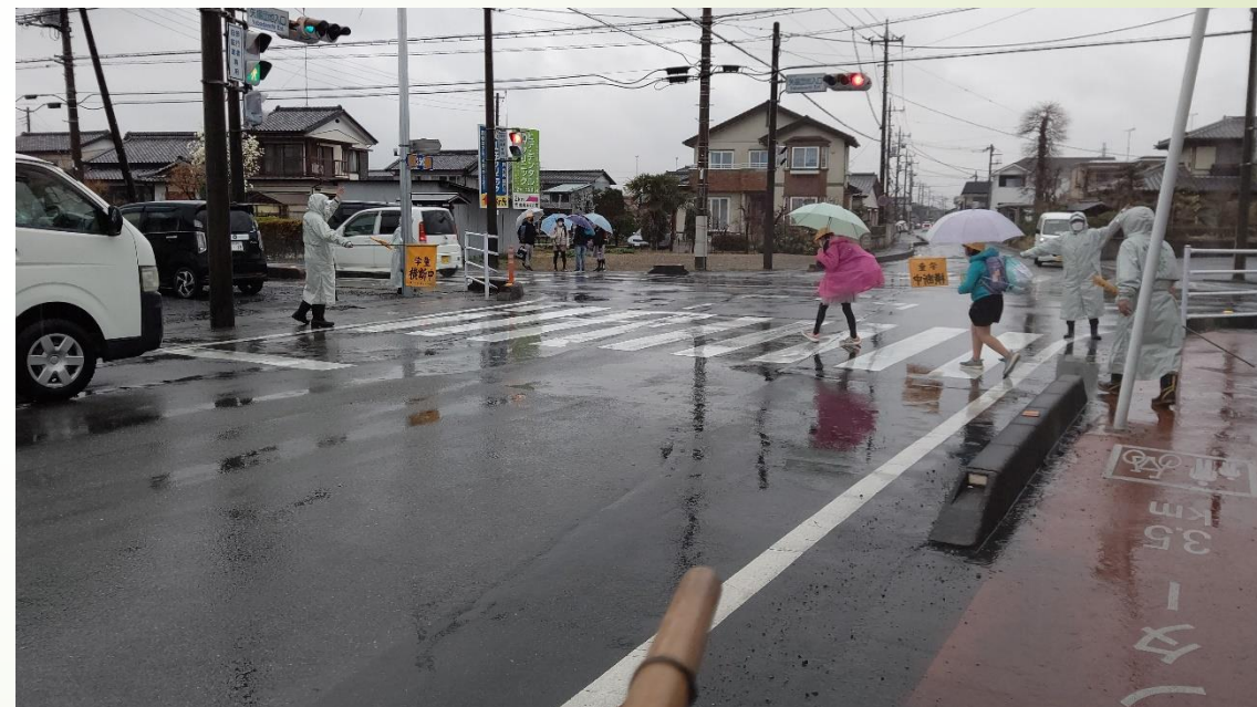
矢場団地入口の信号