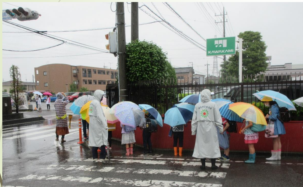
植木野会館入口の信号