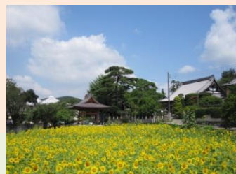
長運寺 住職 若林 泰憲 「鐘楼堂とひまわり畑」