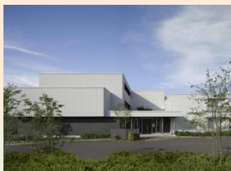
積水ハウス株式会社両毛支店 「MONOLITH」