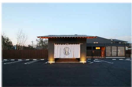
第12回 大賞 あんじゅの森