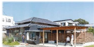
第9回 大賞 太田アートガーデン