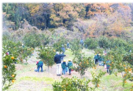
第11回 大賞 菅塩地区景観美活動