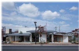
第10回 大賞 ヴァンダラスト