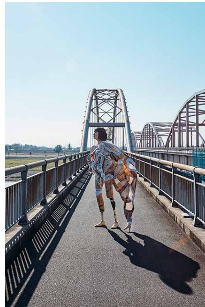
on the way home #001,2016,©Mari Katayama