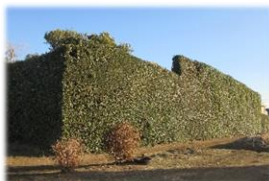
第8回 大賞 樫と椿の防風垣