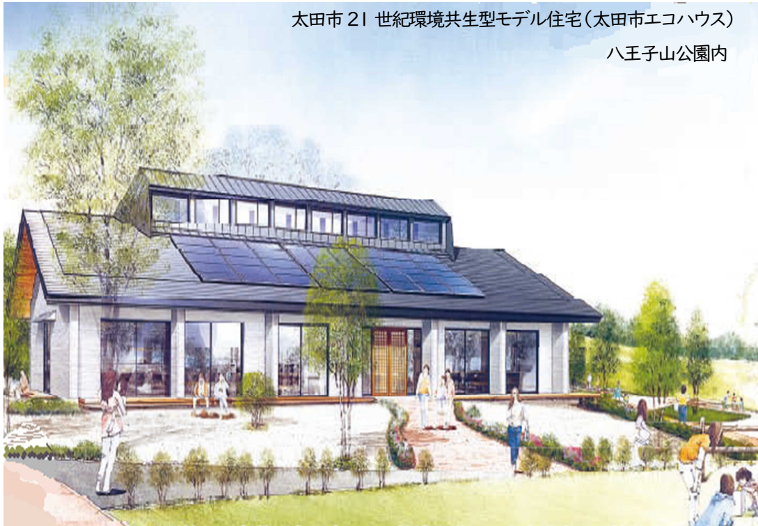
太田市 21世紀環境共生型モデル住宅(太田市エコハウス)