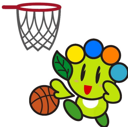
太田市マスコットキャラクター「おおたん」