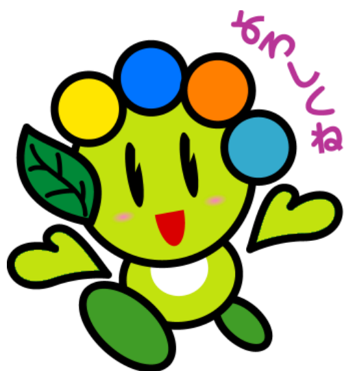
太田市マスコットキャラクター おおたん