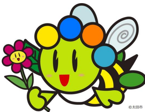
太田市マスコットキャラクター「おおたん」