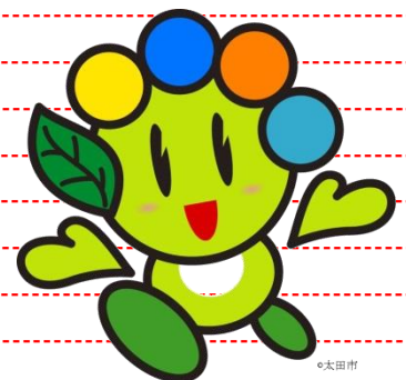
太田市吉祥物 おおたん