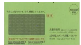
Sobre del Cupón de la 4ª dosis

★Nota: Solamente vacunación de la 3ª dosis.