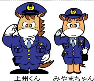
上州くん みやまちゃん