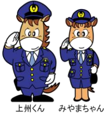
上州くん みやまちゃん