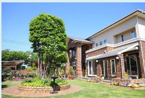
賞: IZUMI garden 荻原 泉