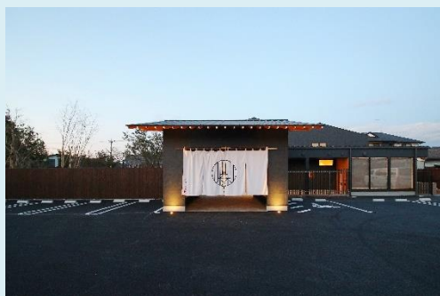
大賞: あんじゆの森 株式会社 明翔メディカル