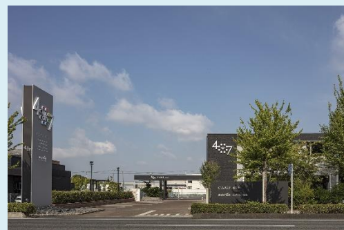
賞: CAMP 407 株式会社 ソニアプラン