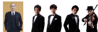
長寿あんしん課 ☎ 47-1829

バスの利用は休泊地区在住者のみ です。申込みの際にバス利用希望と 伝えて下さい。