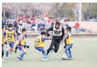
前回開催時の様子