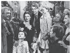
素晴らしき哉、人生!