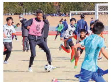
昨年のサッカー教室(陸上競技場)