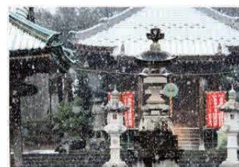
雪の朝(第13回応募作品)