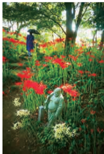
昨年度最優秀作品 「秋の常楽寺」