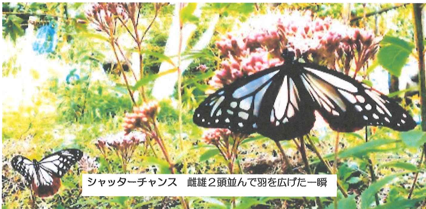
シャッターチャンス 雌雄2頭並んで羽を広げた一瞬