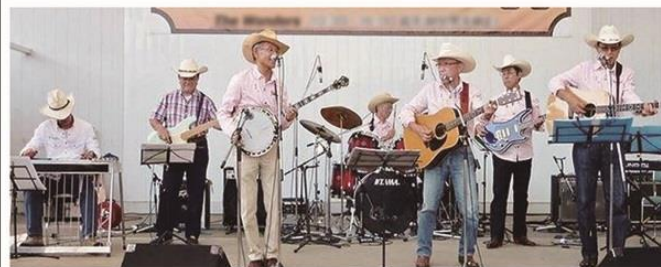
岩槻 THE WONDERS