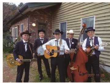
THE OLD TIMERS