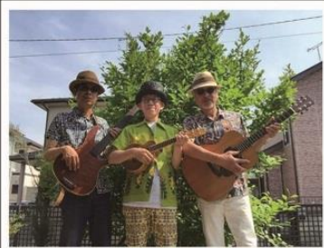
お達者 LONELY HEARTS 倶楽部 BAND