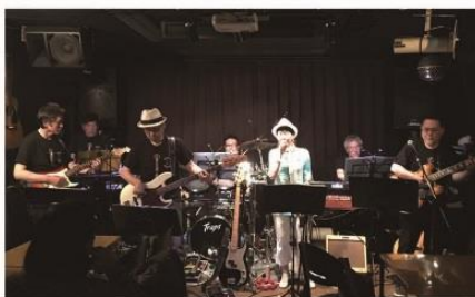
UNCLE SAM & AYA