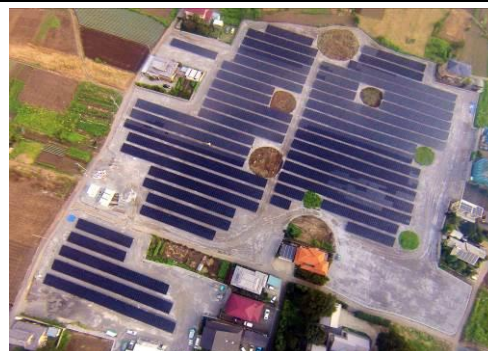
おおた鶴生田町太陽光発電所