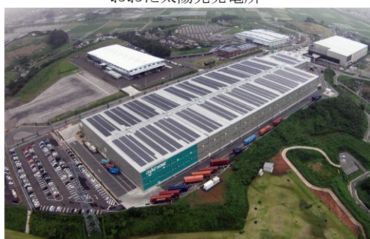
おおた緑町太陽光発電所