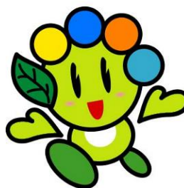
マスコットキャラクター「おおたん」