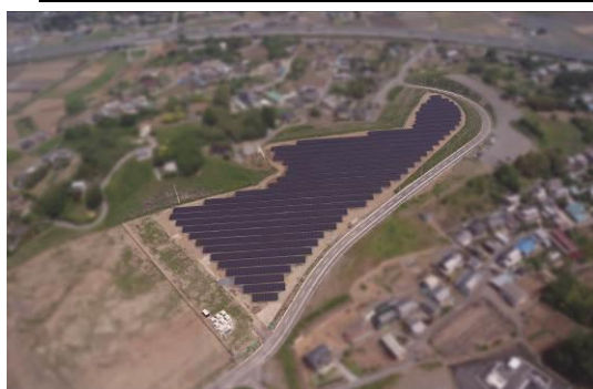
おおた太陽光発電所