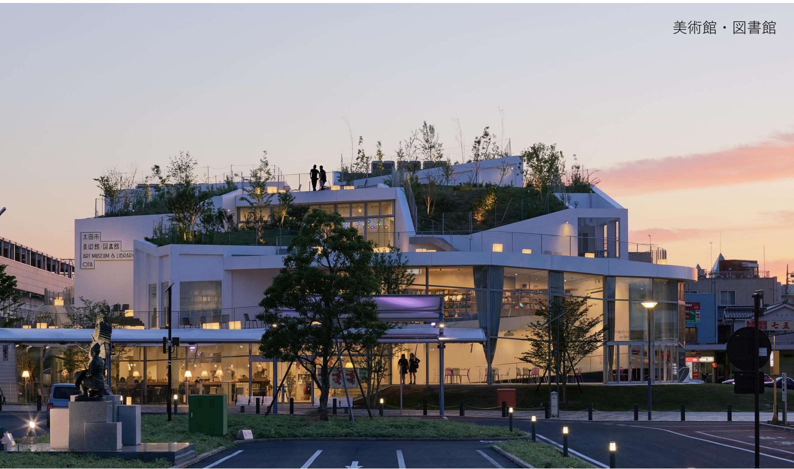
人と自然にやさしく、品格のあるまち 太田