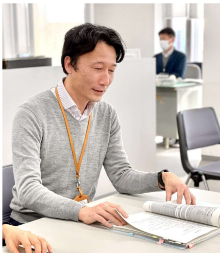
係長職 平成10年入職

革製のネームホルダーとメタルオレンジの多機能ペンは、実用性だけでなく胸元のアクセントにもなるお気に入りアイテムです。