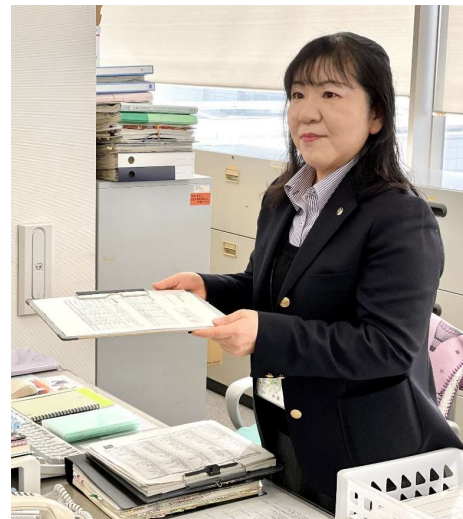
課長職 平成3年入職

重要な仕事の時に験担ぎとして、上司から頂いた青いペンやラッキーカラー（緑）の筆記用具などを携帯するようにしています。