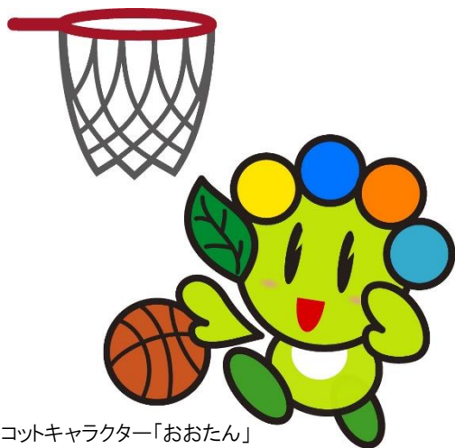
太田市マスコットキャラクター「おおたん」