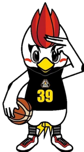
群馬クレインサンダーズ マスコット「サンダくん」