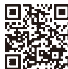
認証キーの取得方法 発注者への提出方法