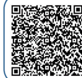
夏休みポスター作成