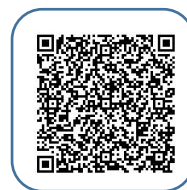
初心者向けスマホ