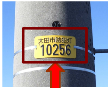
防犯灯管理プレート

不点灯などの灯具不具合は、 プレート番号確認の上、 コールセンター ☎ 0570 - 666 - 181 へ 直接連絡も可能 (夜間休日含め 24 時間対応)