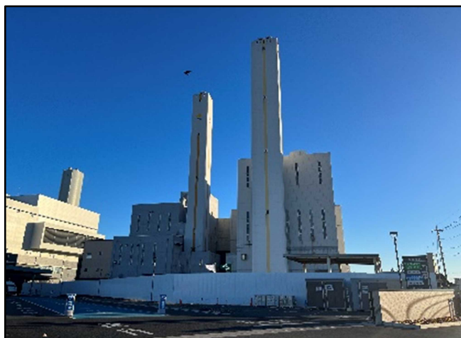
③ 北側仮囲いを設置 3・4号炉焼却棟煙突を確認