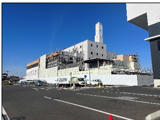
④ 南側仮囲いを設置 3号炉焼却棟と粗大ごみ施設用足場