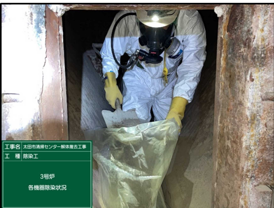
工事名 太田市清掃センター解体撤去工事 工種 除染工 3号炉 各機器除染状況