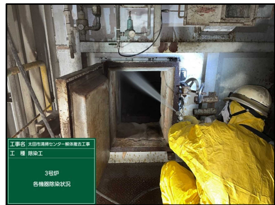
工事名 太田市清掃センター解体撤去工事 工種 除染工 3号炉 各機器除染状況