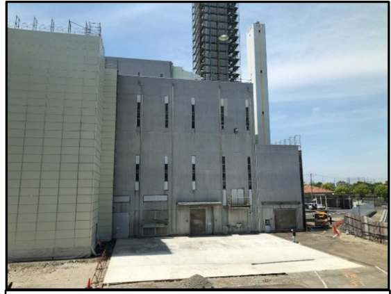
② 仮設テント コンクリート打設