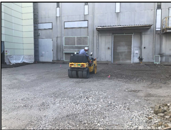
① 仮設テント設置 砕石敷均し