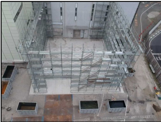
① 仮設テント 脚部ビーム足場設置