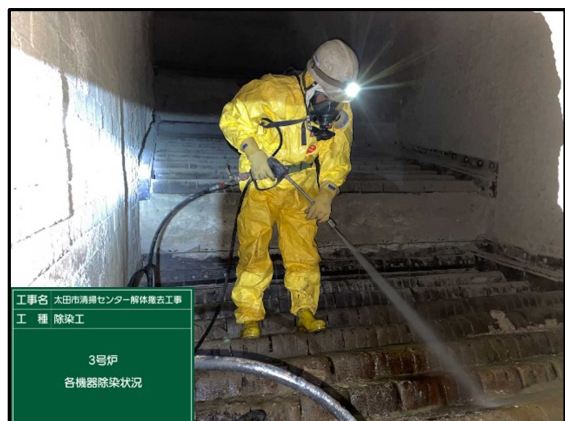
④ 3号炉焼却棟 除染作業