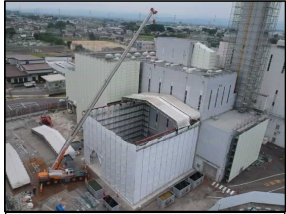
② 仮設テント 屋根組立