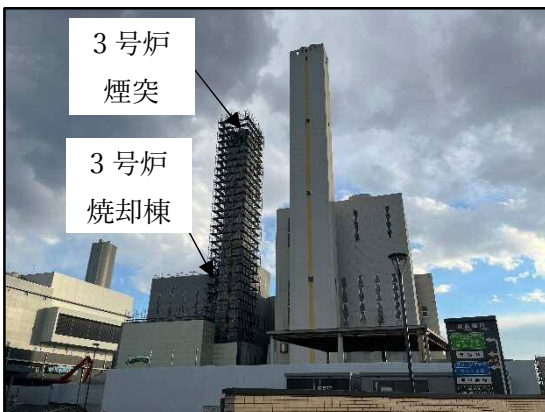
3号炉 煙突 3号炉 焼却棟