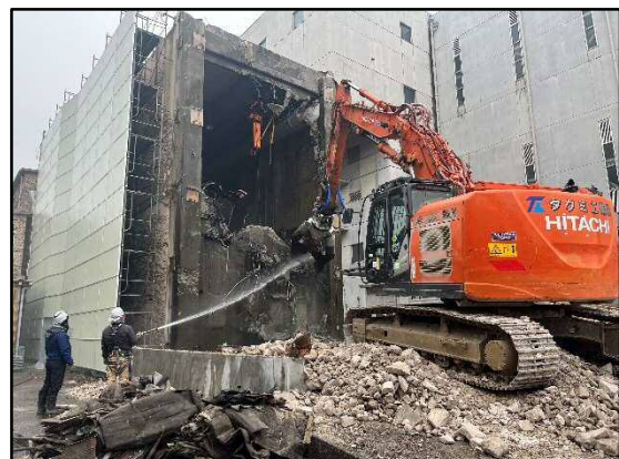
② 粗大ごみ処理施設 建屋解体作業 散水による粉塵防止を実施