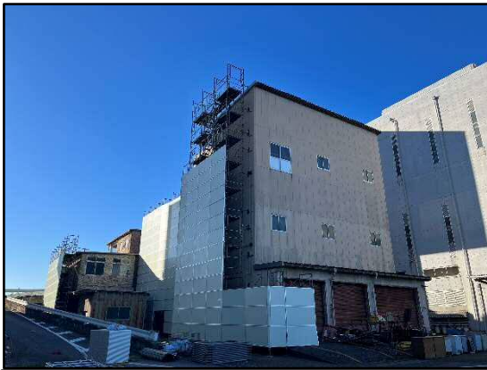
① 粗大ごみ処理施設 足場に飛散防止設備を設置