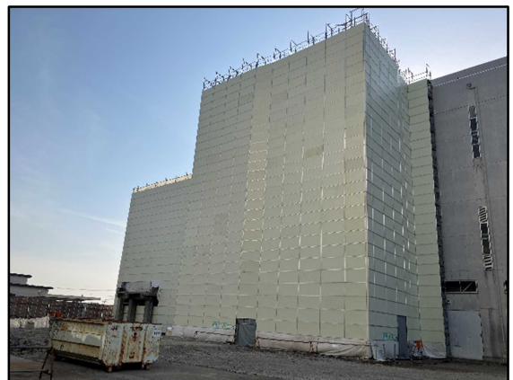
② 3号炉焼却棟 東側足場を設置