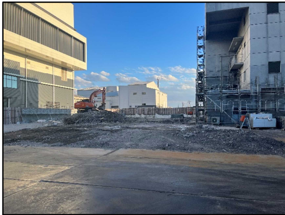
① 粗大ごみ処理施設解体