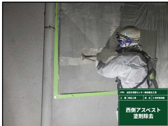
③ 3号炉焼却棟 壁面のアスベスト除去作業