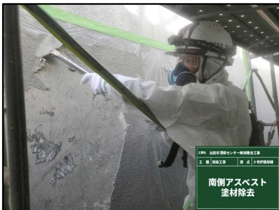
③ 3号炉焼却棟 壁面のアスベスト除去作業