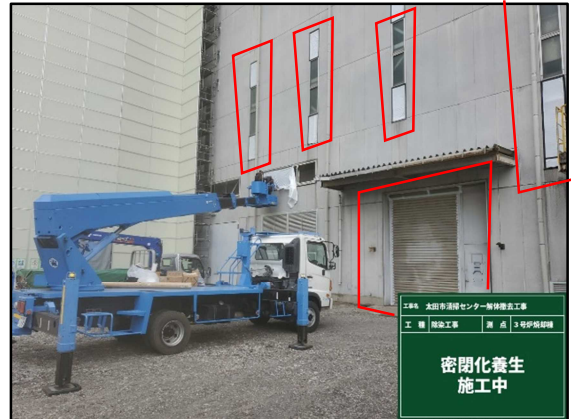
② 3号炉焼却棟 密閉化養生状況