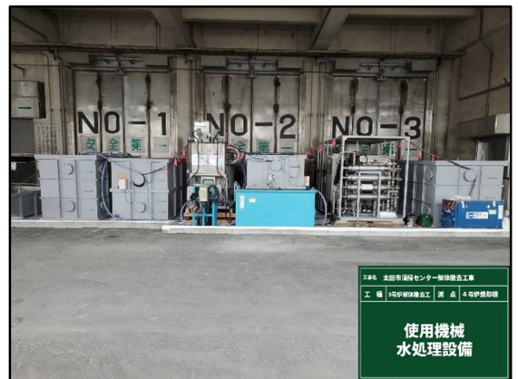
④ 水処理施設を設置