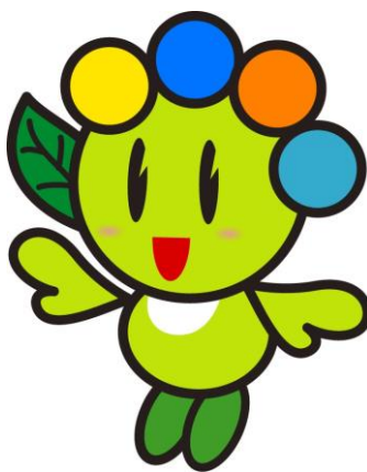
太田市マスコットキャラクター「おおたん」