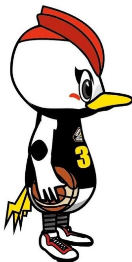
群馬クレインサンダーズ マスコット「サンダくん」