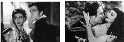
「無敵艦隊」 「クレオパトラ」