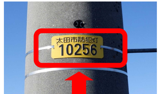
防犯灯管理プレート