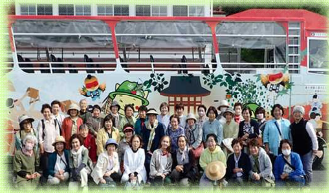
水陸両用バスの前で記念撮影

6月1日(木)いずみレディースアカデミーの館外研修が行われました。「やんば天明泥流ミュージアム」では、江戸時代(天明3年)の浅間山の大噴火により発生した「天明泥流」のミニシアターや大規模発掘調査で発掘された大量の遺物を見学してきました。また、ハッ場水陸両用ダックツアーにも参加し、ハッ場ダムの雄大な自然を満喫してきました。天候にも恵まれ、有意義に過ごすことができました。