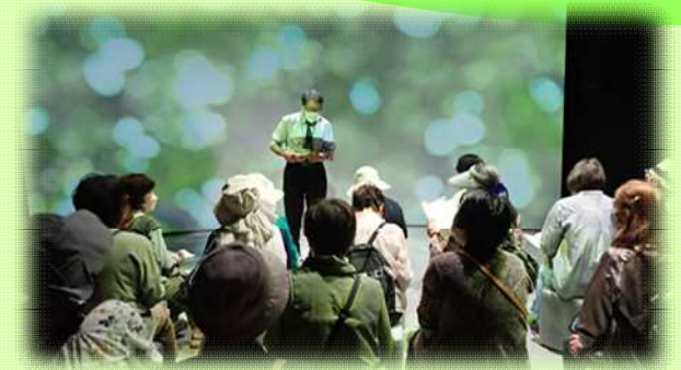
「やんば天明泥流ミュージアム」見学の様子

6月1日(木)いずみレディースアカデミーの館外研修が行われました。「やんば天明泥流ミュージアム」では、江戸時代(天明3年)の浅間山の大噴火により発生した「天明泥流」のミニシアターや大規模発掘調査で発掘された大量の遺物を見学してきました。また、ハッ場水陸両用ダックツアーにも参加し、ハッ場ダムの雄大な自然を満喫してきました。天候にも恵まれ、有意義に過ごすことができました。