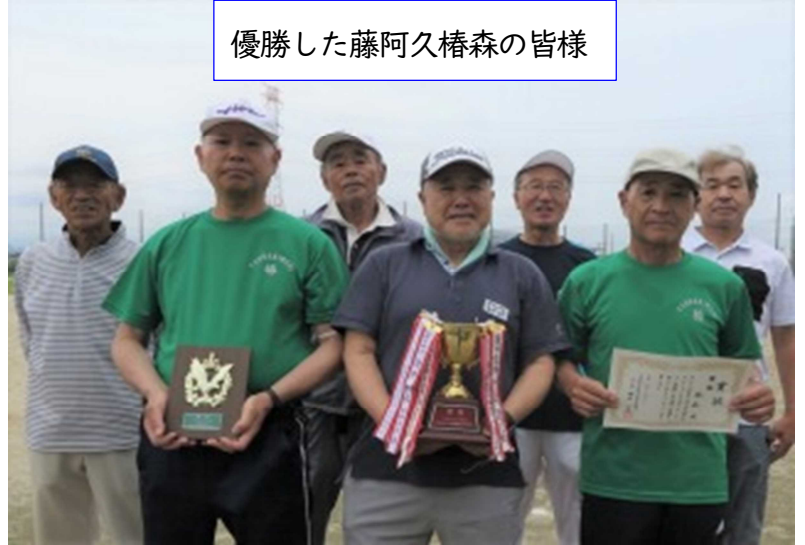
優勝した藤阿久椿森の皆様