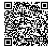
新年度募集状況表