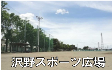
沢野スポーツ広場