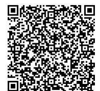
ベビーマッサージと リンパマッサージ

各教室・講座のお申し込みは、各申込期間内に、ぐんま電子申請受付システム(2次元コード読取)または鳥之郷行政センターへ電話でお申し込みください(電話受付は平日の午前9時から午後5時まで)。※受付終了時に定員を超えた場合は、抽選となります。抽選の有無にかかわらず、参加の可否については、後日お知らせします。