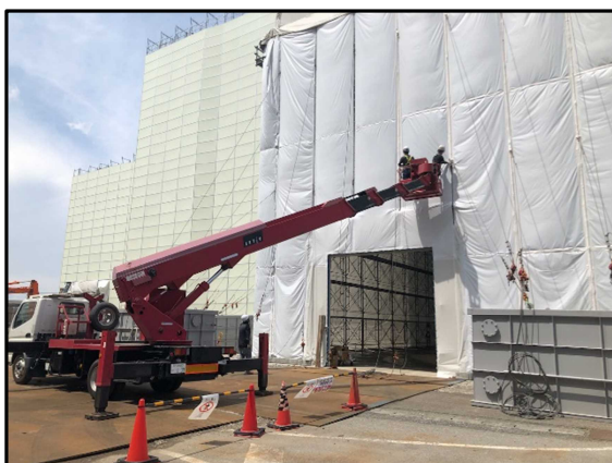
① 3号炉焼却棟仮設テント 密閉化養生