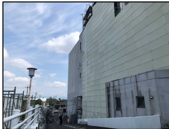
④ 4号炉焼却棟 西側足場を設置