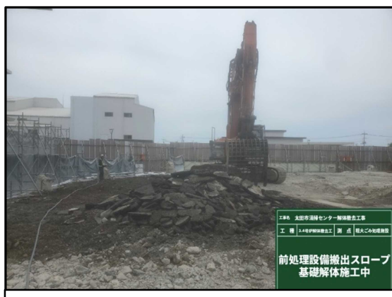
③ 粗大ごみ処理施設基礎 一部解体