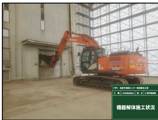
② 3号炉焼却棟 機器解体着手