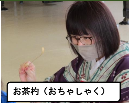
お茶杓（おちゃしゃく）