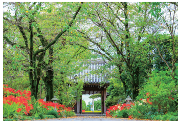
平成29年度大賞「常楽寺境内及建物」