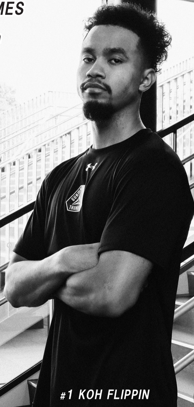
#1 KOH FLIPPIN