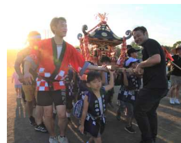
市多村新田 子どもみこし