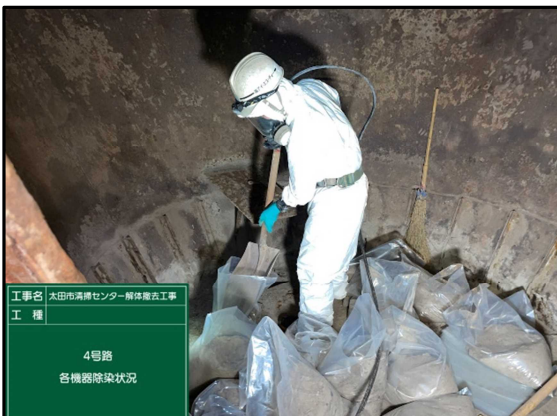
工事名 太田市清掃センター解体撤去工事 工種 4号路 各機器除染状況