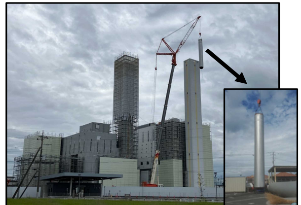
④ 4号炉焼却棟 煙突内筒撤去