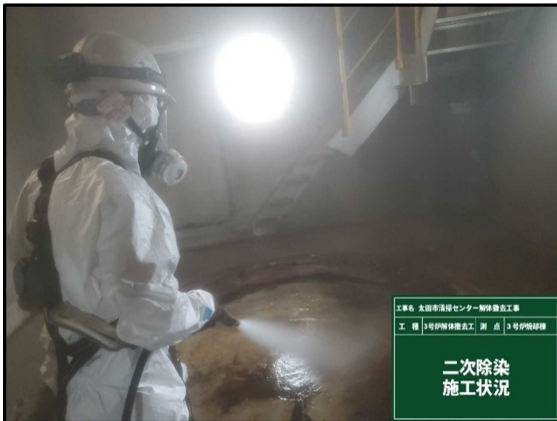
工事名 太田市清掃センター解体撤去工事 工種 3号炉焼却棟施工 測点 3号炉焼却棟 二次除染 施工状況