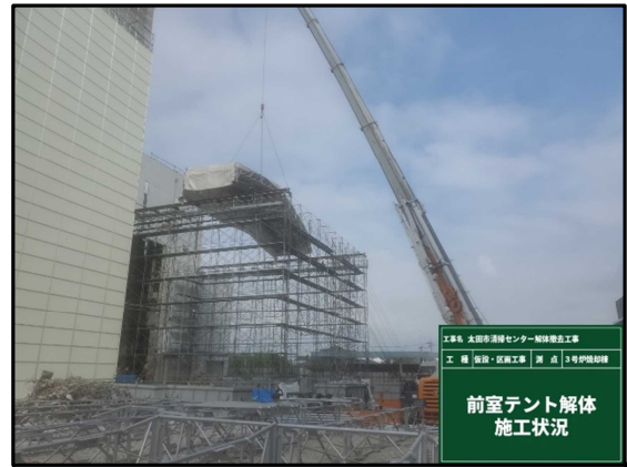
工事名 太田市清掃センター解体撤去工事 工種 仮設・仮設工事 測点 3号炉焼却棟 前室テント解体 施工状況