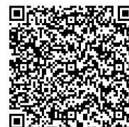
Para la inscripción acceda desde aquí

Para hacer la inscripción, por favor rellene del 1 al 8