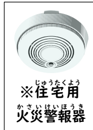
※住宅用火災警報器