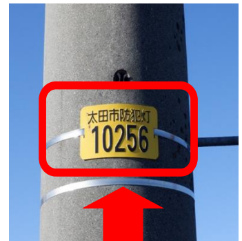
防犯灯管理プレート

なお、防犯灯の維持管理も行っていますので、防犯灯の不具合にお気づきの 場合は、黄色のプレート番号を確認の上、お住まいの地区の防犯委員または 防 犯灯受付コールセンター(電話:0570-666-181) までご連絡ください。